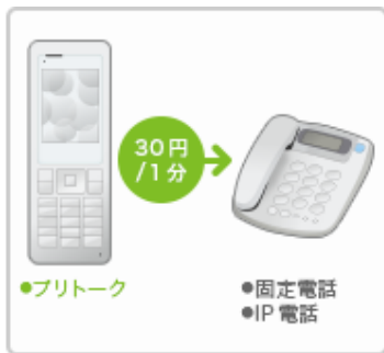
固定電話・IP電話の通話料