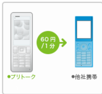
他社携帯の通話料